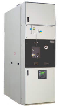
CBGS-2 REN Celda de Secundaria hasta 52 kV