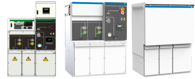
DVCAS Modular Indoor Genius DVCAS Compact Indoor Core DVCAS Compact Outdoor Core