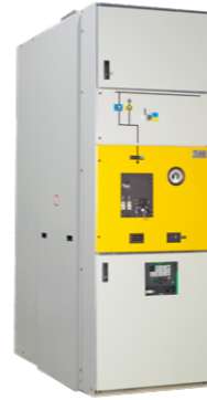
CBGS-2 Celda de Primaria de 52 kV Simple / Doble Barra