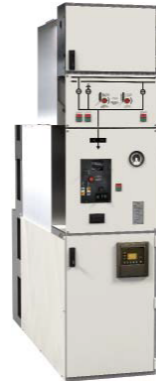
CBGS-1 Celda de Primaria hasta 36 kV Simple / Doble Barra