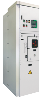
CBGS-0 Celda de Primaria hasta 38 kV Simple Barra