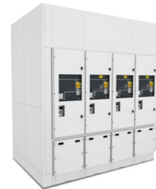
WI-72 Celda de Primaria de 72 kV Simple Barra