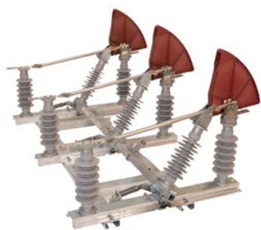
SBCP 36 / 400 CB Basculante polimérico (Cat 440)