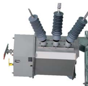
Accionamiento motorizado o manual por sistema de pértiga 36 kV (Cat 404 y 407)