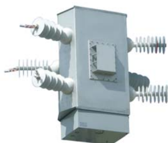
Accionamiento motorizado o manual por transmisión hasta 52 kV (Cat 450)